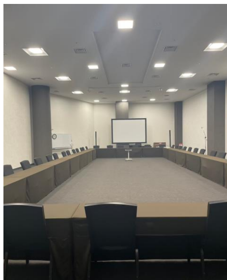
会議室の様子 (ホール2G)

TEL:042-856-3995 FAX:042-856-3994 (株式会社ピースフル 運営事務局宛)